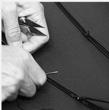
5. SEW UP