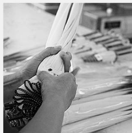
6. QUALITY CHECK