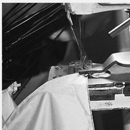
4. TIP ASSEMBLY