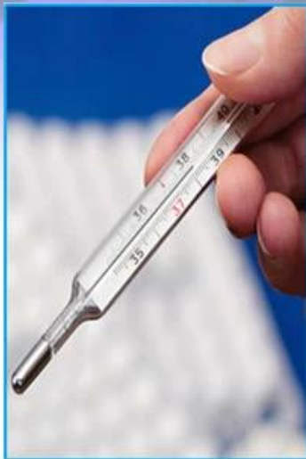
The disadvantage of mercury