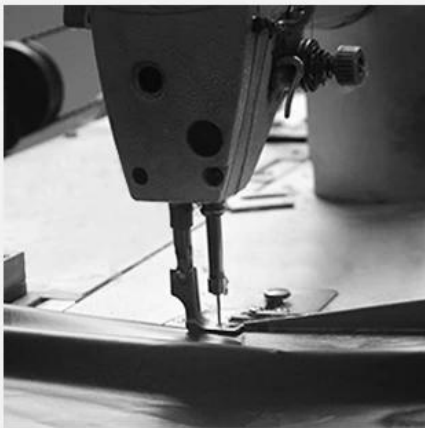
1. EDGE STITCH