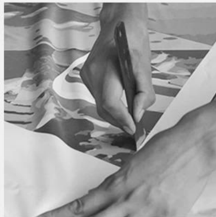
2. CUT FABRIC