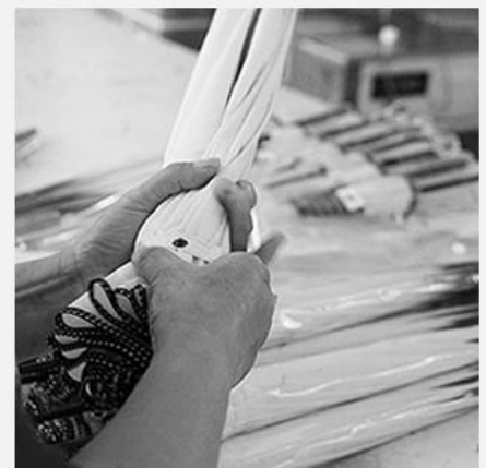
6. QUALITY CHECK