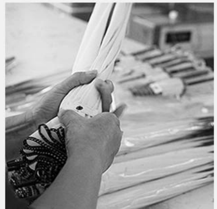
6. QUALITY CHECK