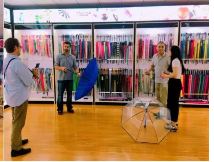
عملية تصنيع المعدات الأصلية