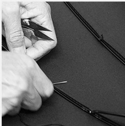
5. SEW UP